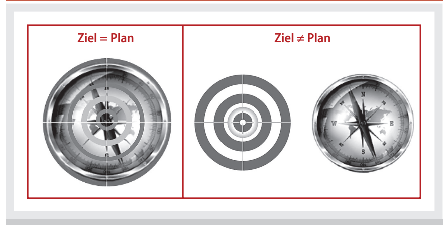
Abb. 1 | Die Doppelnatur von Budgets (links) und Entkopplung von Ziel und Plan (rechts)

Eine mögliche Lösung des zugrunde liegenden Problems muss systematisch bei der Trennung von Zielen und Plänen an-